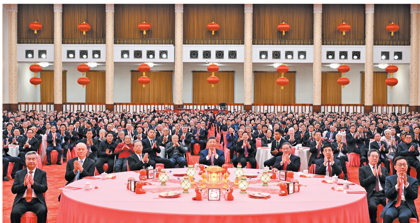
1月27日，中共中央、国务院在北京人民大会堂举行2025年春节团拜会。中共中央总书记、国家主席、中央军委主席习近平发表讲话。