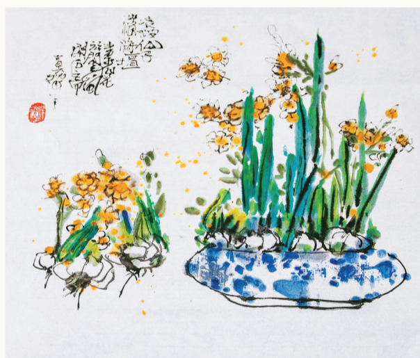
国画《凌波仙子落海坛》