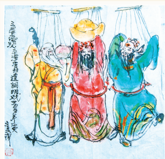
为平潭词明戏创作的国画《三星高照》